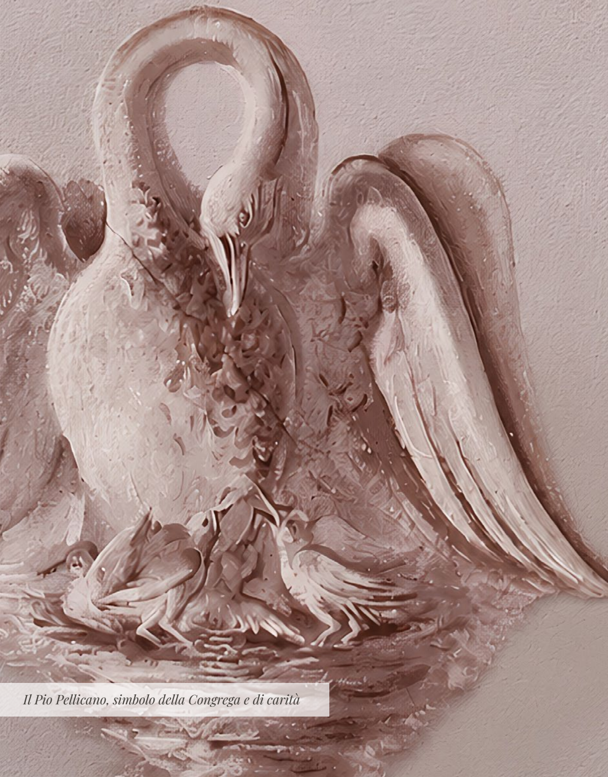
Il Pio Pellicano, simbolo della Congrega e di carità