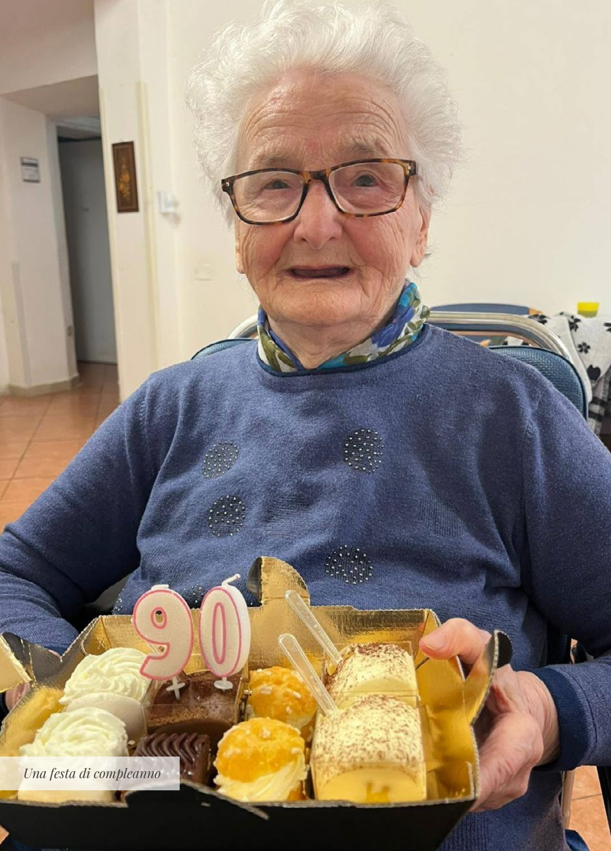
Una festa di compleanno