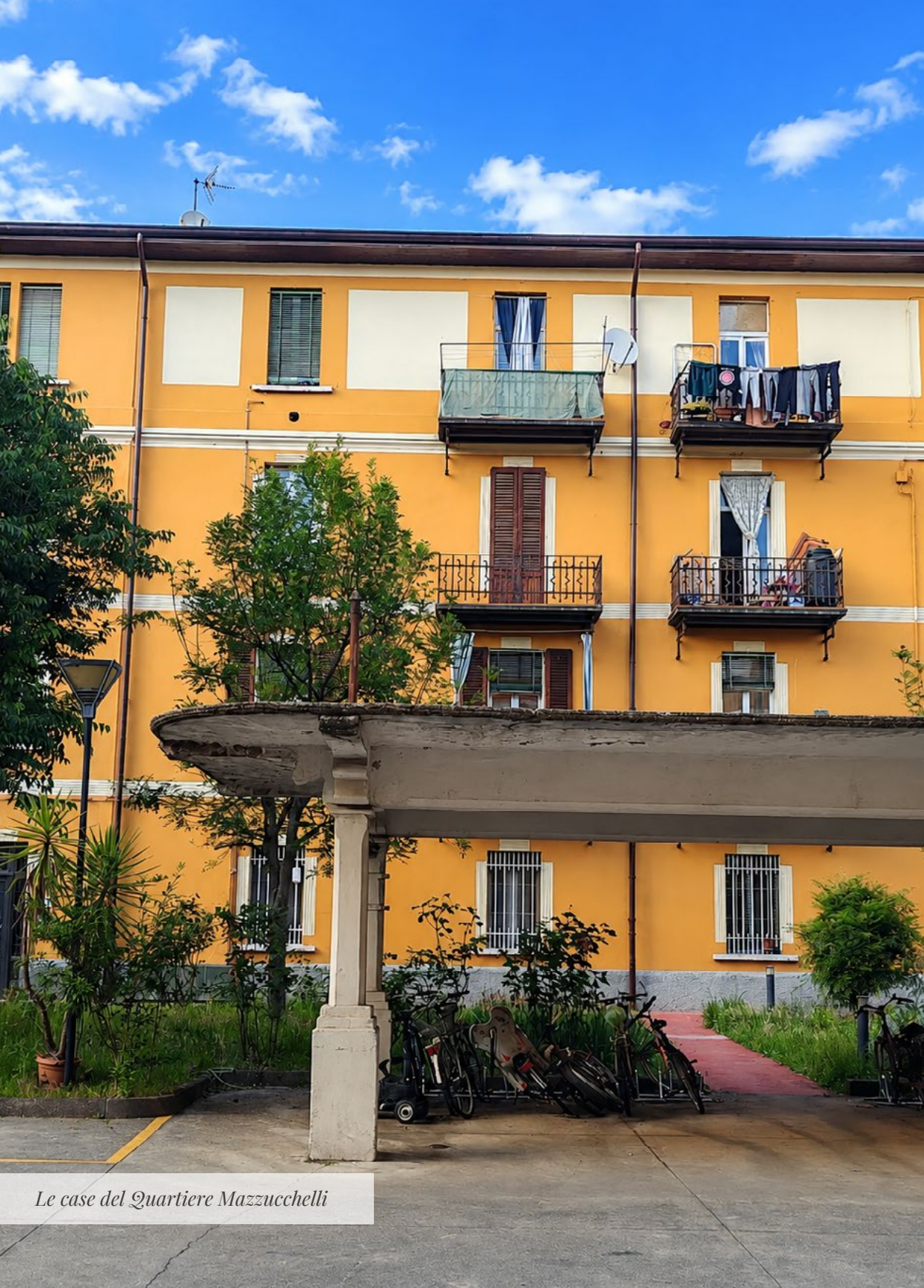
Le case del Quartiere Mazzucchelli