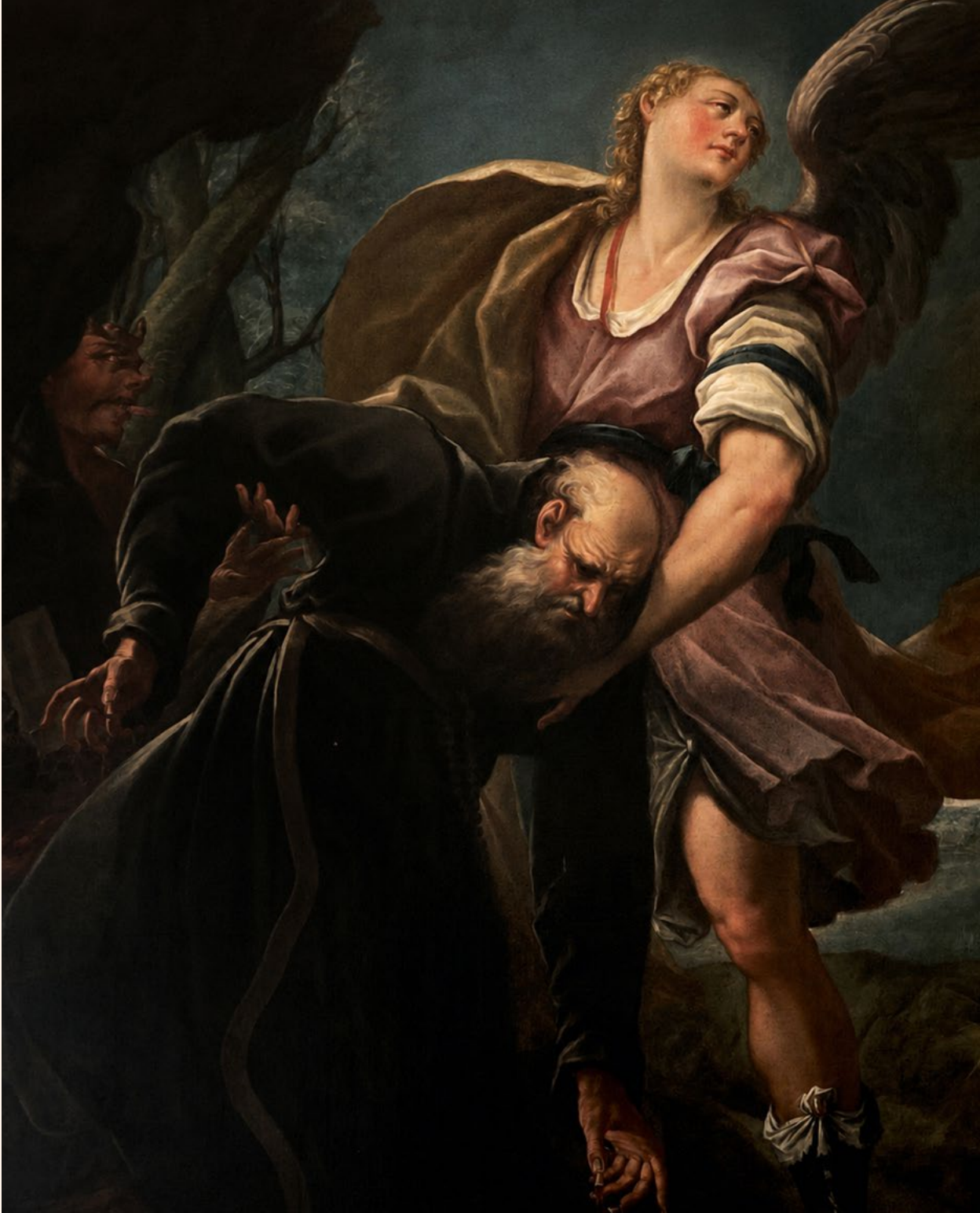
San Giovanni Bono: la tela nella sede della Congrega raffigura il beato mantovano fondatore dell'ordine degli Eremitani e promotore di numerose iniziative di carità